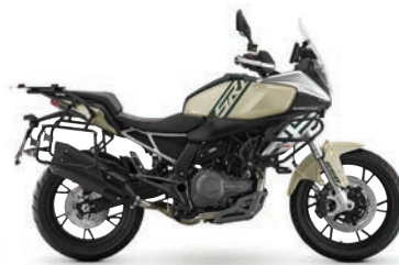
ΤΕΧΝΙΚΑ QJMOTOR SRT 550 S

Ποιο είναι λοιπόν το συμπέρασμα; Η QJMOTOR SRT 550 S είναι μια μοτοσυκλέτα που επιτελεί με περισσά άνεση τον καθημερινό ρόλο του Commuting, δίνοντάς σου όμως και τις δυνατότητες ταξιδιού και την αίσθηση μεγαλύτερης μοτοσυκλέτας (χωρίς όμως το κόστος της). Βάλε σε αυτά τον υπερ-υπερπλήρη εξοπλισμό της και μια τιμή που... δυναμιτίζει την κατηγορία και καταλαβαίνεις γιατί αυτές οι μοτοσυκλέτες (και η λογική που τις συνοδεύει) κερδίζουν συνεχώς έδαφος σε Ελλάδα και Ευρώπη.